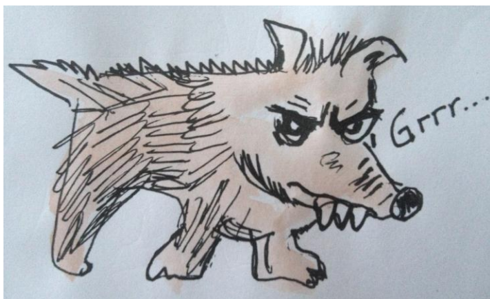
En gammal ovän

Vi kanske t.ex. tidigare har blivit biten av en hund. Vi har därför kanske utvecklat en tendens att uppleva alla hundar som farliga.